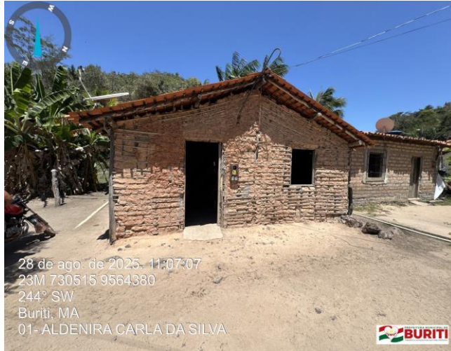
Figura 1: Foto do Terreno