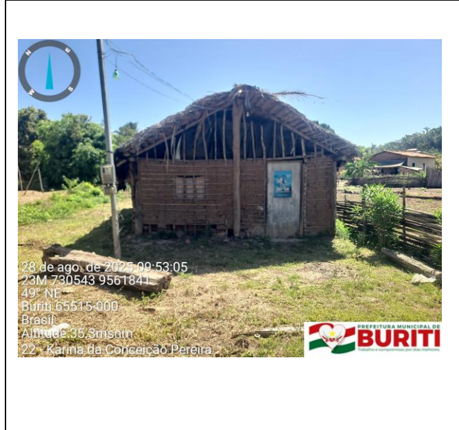
Figura 1: Foto do Terreno